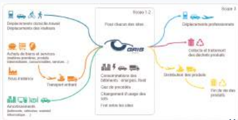
Périmètre de l'analyse

Enfin, un atelier a été organisé en octobre 2022 pour réfléchir à des stratégies et à des outils pouvant être mis en place dans notre entreprise afin de produire de façon encore plus responsable.