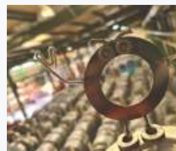
La photo gagnante

Le gagnant a remporté une carte cadeau de 50€ !